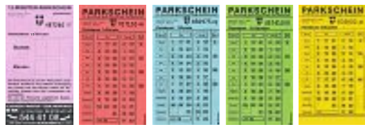
15 min. 1/2 h 1 h 1 1/2 h 2 h Dauer / Duration